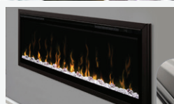
Trousse de garnitures Ignite XL